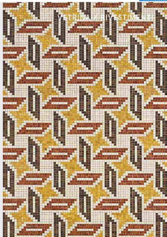
VETRINA / RIVESTIMENTI