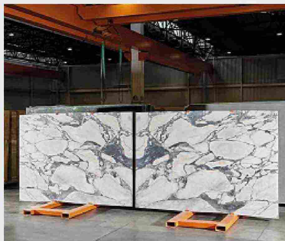
Margraf Notre Dame, marmo dal fondo chiaro con venature scure. Anche a macchia aperta, in finitura lucida, levigata o spazzolata ➤ MARGRAF.IT