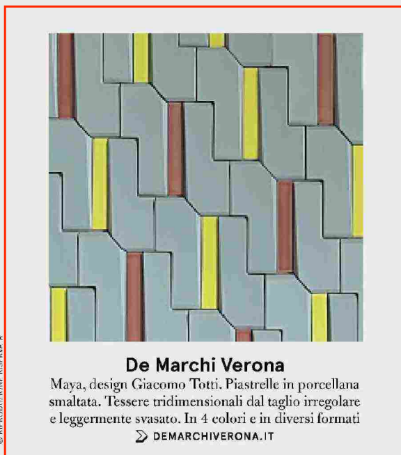
De Marchi Verona Maya, design Giacomo Totti. Piastrelle in porcellana smaltata. Tessere tridimensionali dal taglio irregolare e leggermente svasato. In 4 colori e in diversi formati ➤ DEMARCHIVERONA.IT