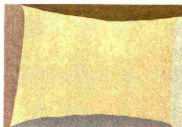
4 Nanimarquina | 2.660€