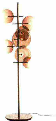
5 Gallotti&Radice | prezzo su richiesta