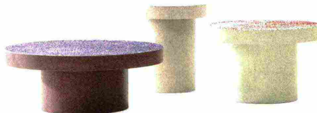
1 Cimento | prezzo su richiesta

Volumi morbidi e arrotondati e tonalità tenui e soavi conferiscono agli ambienti sensazioni positive e invitano al comfort. In particolare, sono le forme avvolgenti e sferiche a restituire allo spazio una sensazione di benessere, tondo è l'inusuale letto Bordone di MyHome Collection (6) e tondi sono anche gli elementi che compongono la lampada da tavolo Soft Blown di porcellana disegnata da Luca Nichetto per Lladró (7) . Volumi organici che sembrano abbracciare, come nel caso della poltroncina Nora di Bross (2) , o per la lampada Bolle Stelo proposta nella nuova versione anniversario in occasione dei dieci anni. Alle forme morbide che favoriscono l'armonia domestica fanno eco i colori tenui e neutri, sfumature pastello vestono mobili e complementi d'arredo come i tavolini da caffè Frari disegnati da Patricia Urquiola per Cimento (1) e il tappeto Tones di Nanimarquina (4) , ma le forme morbide catturano anche le superfici: un esempio è la nuovissima collezione di rivestimenti in porcellana Cadenza di De Marchi Verona (3) che mostra un pattern dinamico e sinuoso.