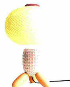
7 Lladró | 995€