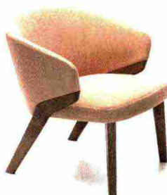
2 Bross | da 1000€