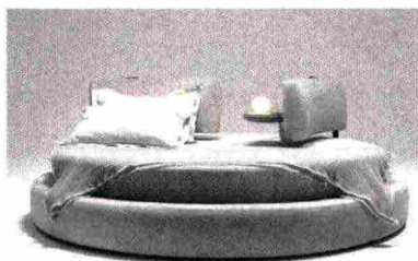
6 MyHome Collection | da 12.000€